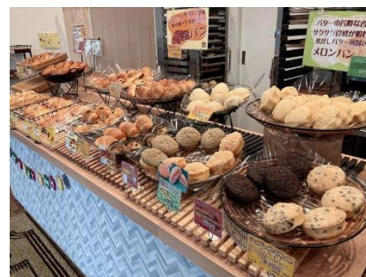
販売品目（イメージ）